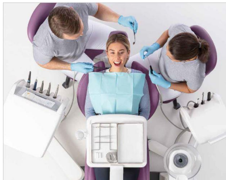
Fig. 4: Vías de agarre optimizadas. el elemento odontológico, el auxiliar y también la bandeja pueden posicionarse de forma independiente.