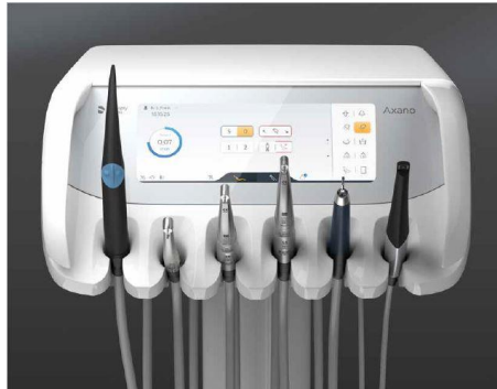
Fig. 2: La gran pantalla gráfica táctil es fácil de manejar y se puede configurar manualmente.