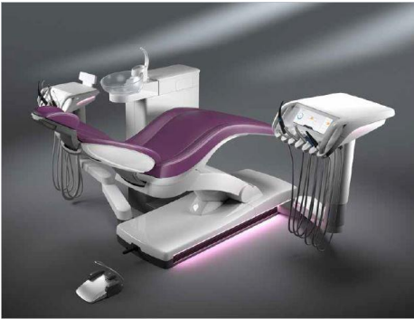
Fig. 1: La Ambient Light de Axano completa el concepto de iluminación del consultorio y hace visible el proceso de higiene.

disponible en la página web para su > descarga .