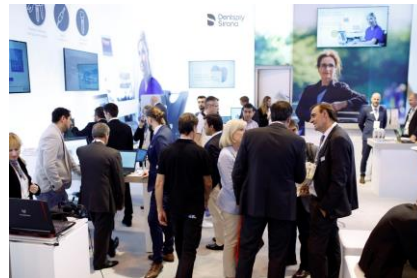
Fig.4: En el congreso EAO-SEPES, Dentsply Sirona ofrece a los clínicos dos opciones distintas de flujos de trabajo digitales