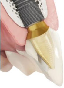
Fig.1: Solución Atlantis CustomBase para Astra Tech Implant System EV

disponible en la página web para su > descarga .