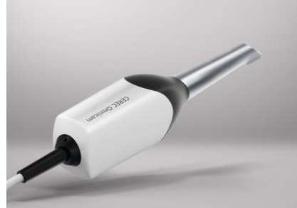
Fig.2: CEREC Omnicam