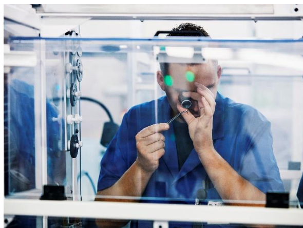
Fig. 6: Uno de los 750 empleados de Maillefer hoy en día