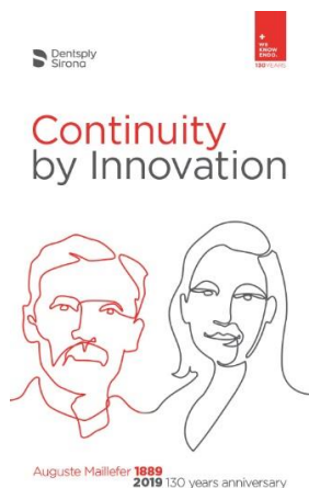
Fig. 1: El logo: 130 años de Maillefer

disponible en la página web para su > descarga .