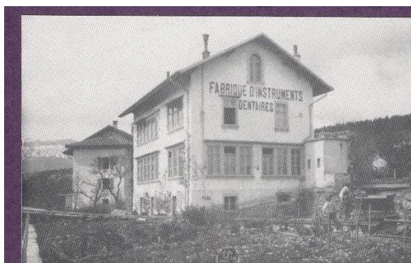
Fig. 3: El histórico centro de producción de los productos Maillefer.