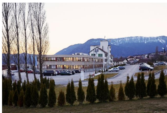
Fig. 4: Sede de Maillefer/Dentsply Sirona Endodontics en la actualidad.