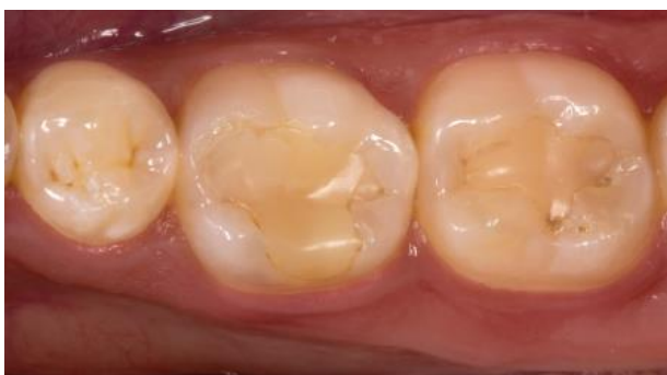
Fig. 3: Situación inicial del caso clínico ganador.