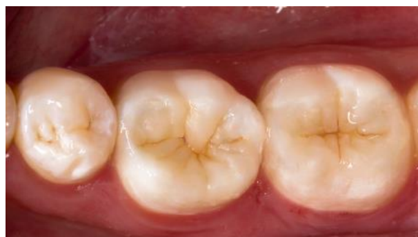
Fig. 4: Situación final del caso clínico ganador después de usar productos de la línea Dentsply Sirona Restorative.