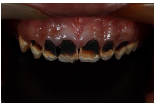
Fig. 5: El caso de estudio del ganador. La situación antes de la cirugía presentaba lesiones de caries graves y defectos en el esmalte dental.