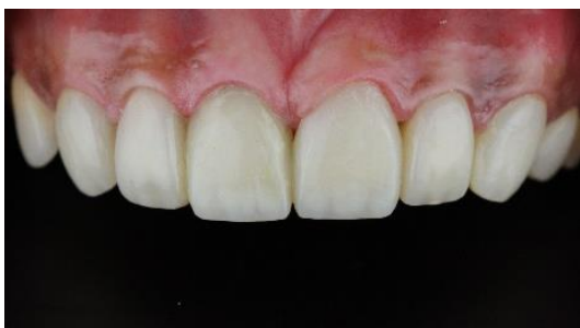
Fig. 6: El caso de estudio ganador de este año. El resultado final no solo es estéticamente natural, sino que también restaura la función efectiva.