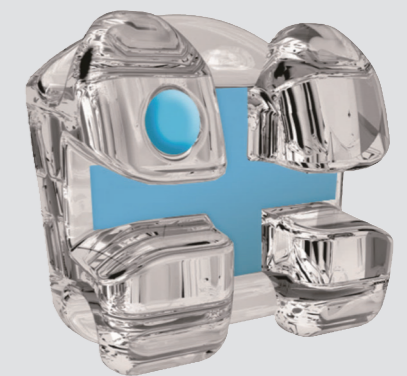
ツールズインデザインのイメージ