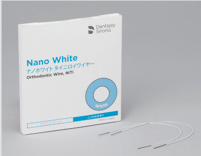
ホワイトコーティングワイヤー：ナノホワイト

DENTSPLY SIRONA Ovation Sとご一緒にホワイトコーティングワイヤー「ナノホワイト」と「プロリガチャーのクリア」を組み合わせた審美矯正をお勧めしております。