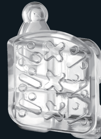
ベース面の形状イメージ

メカニカルベースで安定した機械的嵌合を獲得。必要以上に化学的結合を求めません。そのため、ディボンディングしやすくなっています。