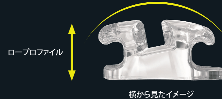
ロープロファイル

ロープロファイルであることに加え、タイウイングのエッジとフックは丸みを帯びた形状になっており、装着した際に患者の違和感を軽減します。