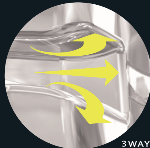
3WAY スロープのイメージ

スロットの開口部分が3方向にテーパがあるため (= 3WAY スロープ)、ワイヤーの引っかかりが起こりにくく、スロットの破損を防ぎフリクションを軽減しやすくなっています。