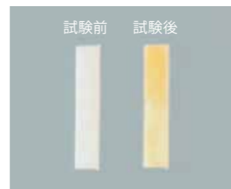
アルミナセラミックス 黄色または薄い黄色に不均一に 染まっています。