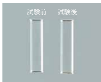
クリスタブレース7 色素の吸着がほとんど目立ちません。

よごれや色素の吸着が少なく、 いつまでも清潔な透明感を保つ。 高濃度ターメリック浸透試験に おいて色素の吸着が少ないことが 確認されました。