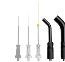
Fibres jetables stériles et conducteurs à tige en verre pour diverses applications,