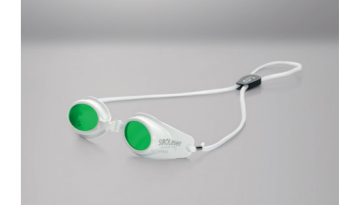
Lunettes de protection laser pour les patients