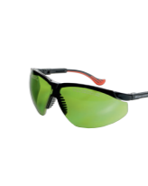
Lunettes de protection laser pour l'utilisateur