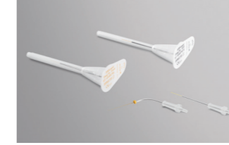
Fibres jetables emballées de façon stérile (EasyTips)