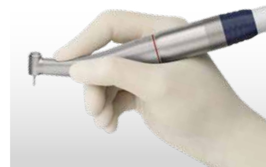
Ermüdungsfreies Arbeiten durch ergonomisches Design.