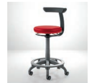
Carl Manual Plus