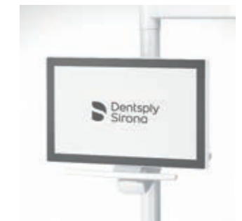
Monitor, 22", an der Leuchtaufbaustange