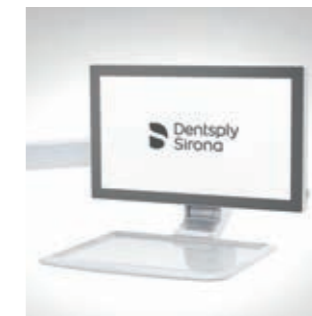
Monitor, 22", am Tray