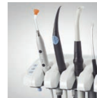
Polylicht Satelec mini LED