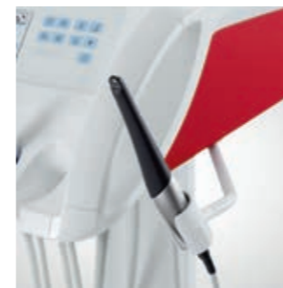
SiroCam AF+ in der Zusatzablage