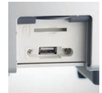
USB-Schnittstelle im Arztelement