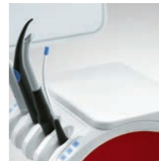
Zusatzablage Assistenzelement (Silikonauflage)