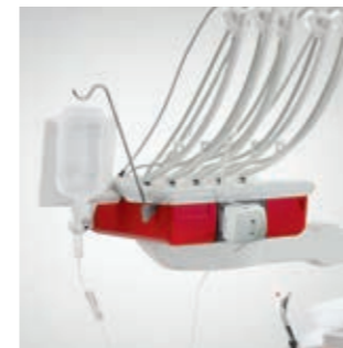
Integrierte Pumpe für Kochsalzlösung