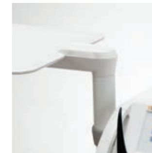
Schwenkbares Tray (bei Sinus TS)