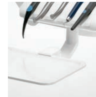
Schwenkbarer Tray-Halter (bei Sinus CS)