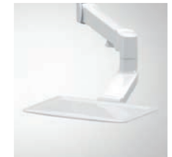
Dentsply Sirona Tray (bei Sinus)